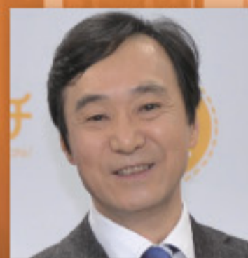
柳澤 秀夫 (NHK解説委員)