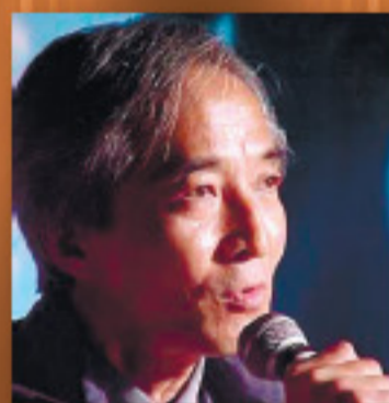
吉岡 忍 (作家)